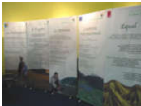
salon AgriTour à Arezzo(dec.2003) salone Agri&Tour ad Arezzo (dec.2003)