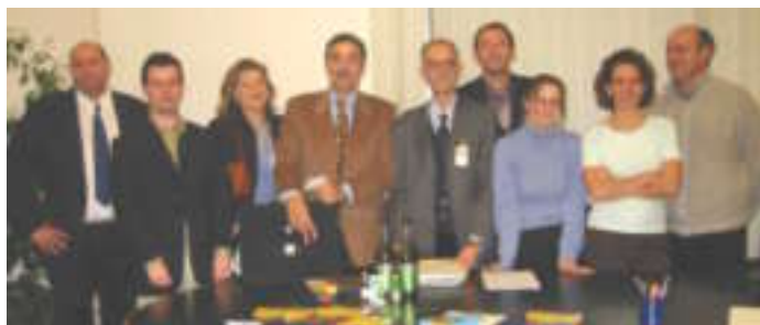
Rencontre transnationale à l'occasion du salon AgriTour à Arezzo(dec.2003) Incontro transnazionale in occasione del salone Agri&Tour ad Arezzo (dec.2003)

Con la fine del progetto « Aree protette » anche l'avventura transnazionale di MANO giunge alla sua conclusione. Ecco dunque a voi l'ultimo bollettino. !!