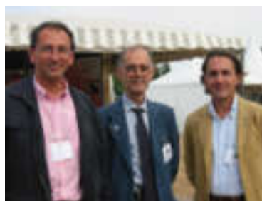
SAFIR – septembre 2003 SAFIR – settembre 2003