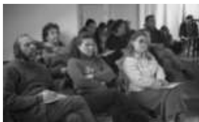
Visite d'agriculteurs italiens en France – novembre 2004 Visita di agricoltori italiani in Francia – novembre 2004